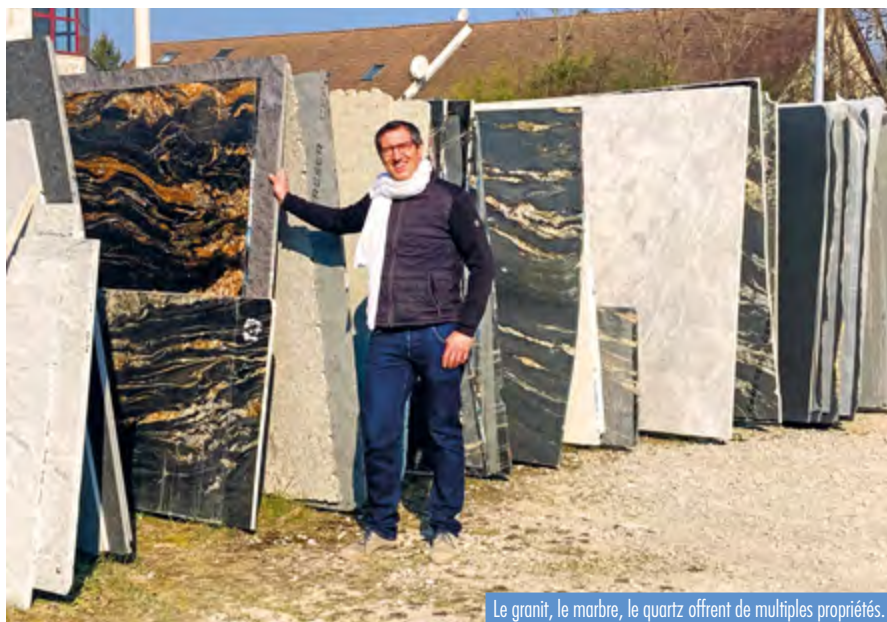
Le granit, le marbre, le quartz offrent de multiples propriétés.

Entre-temps, Renaud Bouly a fait appel, une première fois en mai 2020, au service création-transmission-reprise de la CMA de la Haute-Savoie