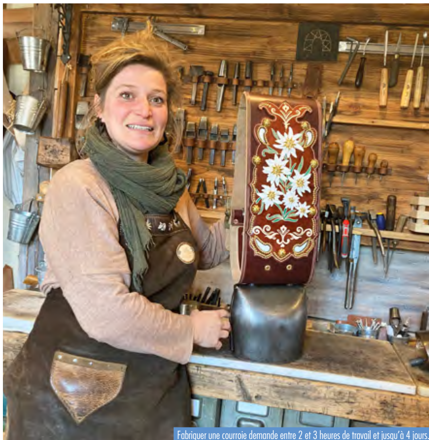
Fabriquer une courroie demande entre 2 et 3 heures de travail et jusqu'à 4 jours.